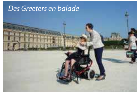
Des Greeters en balade

Nous nous sommes organisés pour gérer des balades avec des participants en situation de handicap et nous avons sensibilisé une partie de notre équipe de bénévoles pour accueillir ces publics particuliers et leur offrir des conditions de balades confortables de visite.