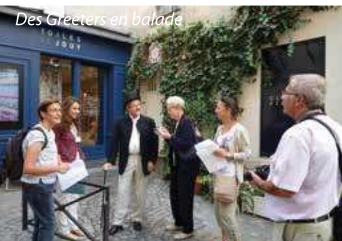
Des Greeters en balade

Notre réseau au-delà de la région parisienne